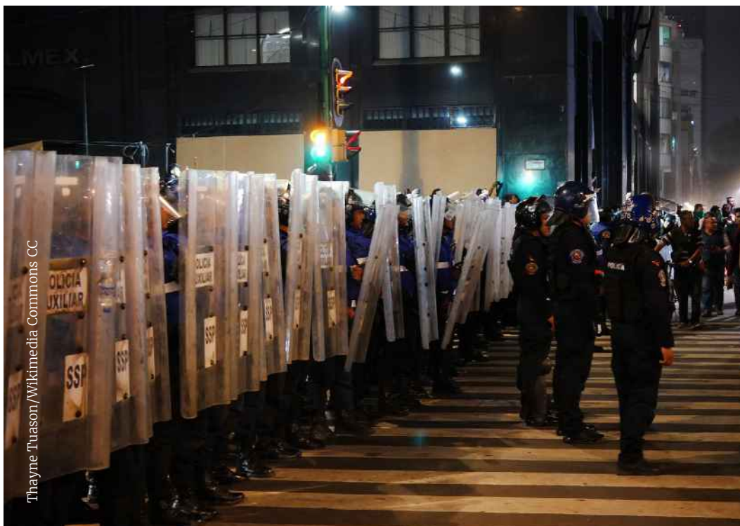
Построение мексиканских полицейских. Международный день борьбы за ликвидацию насилия в отношении женщин, 2019 г.

Широкая доступность различных видов «менее смертоносного оружия» может способствовать чрезмерному применению силы сотрудниками правоохранительных органов, если такое применение не будет строго контролироваться. И вопреки требованиям Основных принципов (принципы 2 и 3), такие виды оружия часто используются ненадлежащим образом. В связи с этим важно подчеркнуть, что такие виды оружия не должны применяться вместо ненасильственных средств или против не представляющих угрозы лиц , в том числе тех, чья свобода уже ограничена.