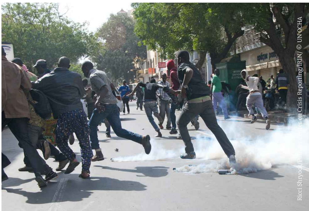
В толпу демонстрантов швыряют емкость со слезоточивым газом. Дакар, Сенегал.

Согласно принципу 2 Основных принципов, должностные лица по поддержанию правопорядка должны быть оснащены различными видами оружия и боеприпасов, позволяющими дифференцированно применять силу и огнестрельное оружие в соответствии с тем, что необходимо и соразмерно в конкретных обстоятельствах, включая ситуации, когда они используют «процедуру эскалации силы» или «континуум применения силы». Согласно этому требованию, сотрудники правоохранительных органов должны быть, в частности, оснащены снаряжением для самозащиты (см. вопрос 10).