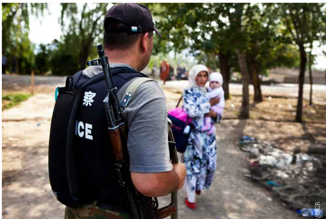
Ош (Кыргызстан). Город Ош на границе с Узбекистаном. Узбекские беженцы возвращаются домой.

Принцип законности (Основные принципы, принцип 1) требует от государств принятия норм и нормативных положений, регулирующих все обстоятельства применения силы (кто, когда и как); согласно принципу необходимости , сотрудники правоохранительных органов могут применять силу только в случае крайней необходимости (Кодекс поведения, ст. 3). Любое такое применение должно считаться исключительной мерой, к которой прибегают в последнюю очередь и, в соответствии с законной целью поддержания правопорядка, применяя для ее достижения такие средства, которые наносят как можно меньший ущерб. Это подразумевает использование, насколько возможно, ненасильственных средств прежде применения силы и огнестрельного оружия (Основные принципы, принцип 4).