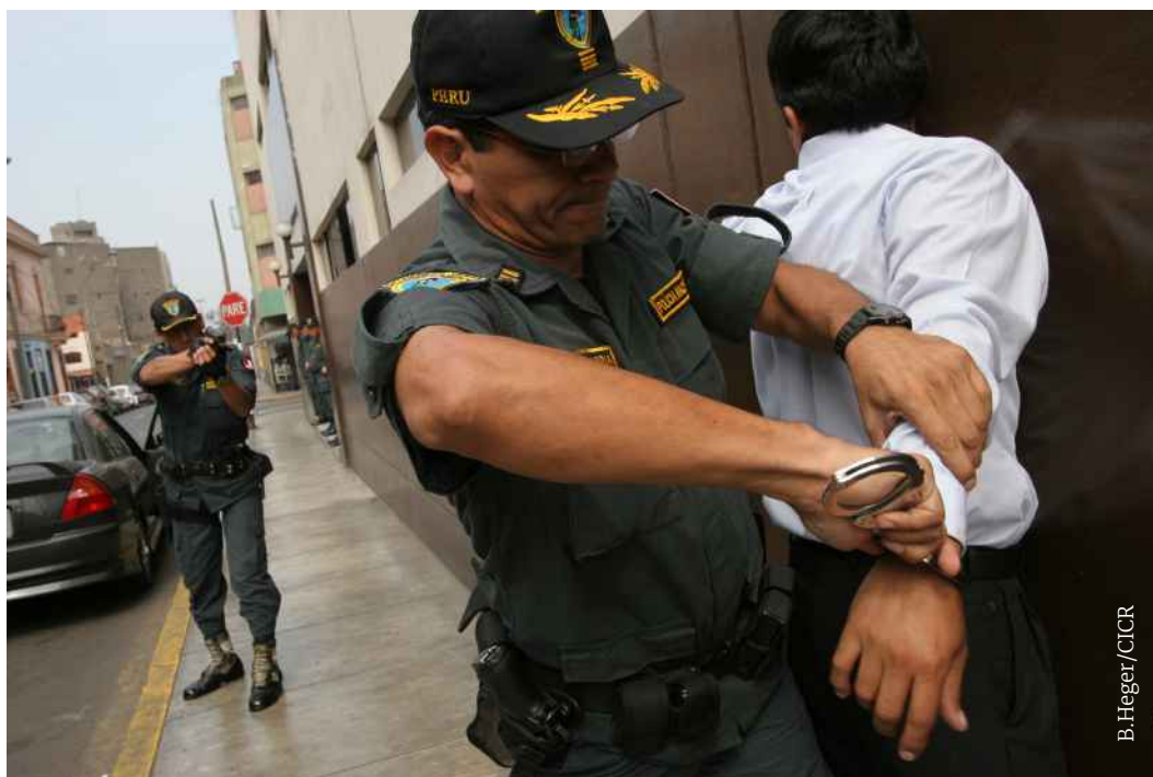
Лима. Учения по применению силы и соблюдению прав человека. Отработка задержания подозреваемого на улице.

В международном праве огнестрельное оружие означает «любое носимое ствольное оружие, которое производит выстрел, предназначено или может быть легко приспособлено для производства выстрела или ускорения пули или снаряда за счет энергии взрывчатого