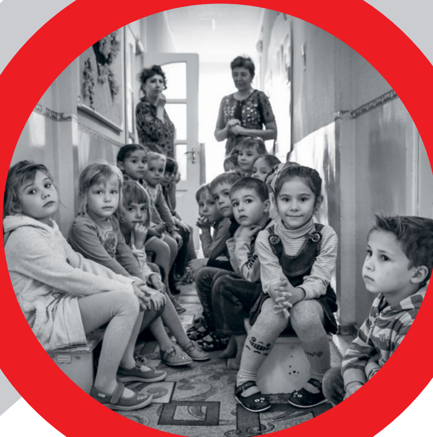
Фото обложки: Ломбок, Индонезия, 2019 г. По прошествии почти полугода после многочисленных землетрясений, которые произошли в Ломбоке, сотрудники и добровольцы Индонезийского Красного Креста продолжают посещать школы в пострадавших районах, чтобы предоставлять учащимся и учителям образовательные материалы и социально-психологическую поддержку. Они также играют с детьми в игры, в том числе ролевые, позволяющие освоить наиболее рациональные гигиенические навыки, способы снижения рисков и основы оказания первой помощи.

Село Гранитное, Донецкая область, Украина, 2018 г. Ученики и учителя укрываются в школьном коридоре, в то время как на окраине села грохочут взрывы. МККК повышает уровень физической безопасности школ и помогает учителям и учащимся лучше понимать риски и правильно на них реагировать.