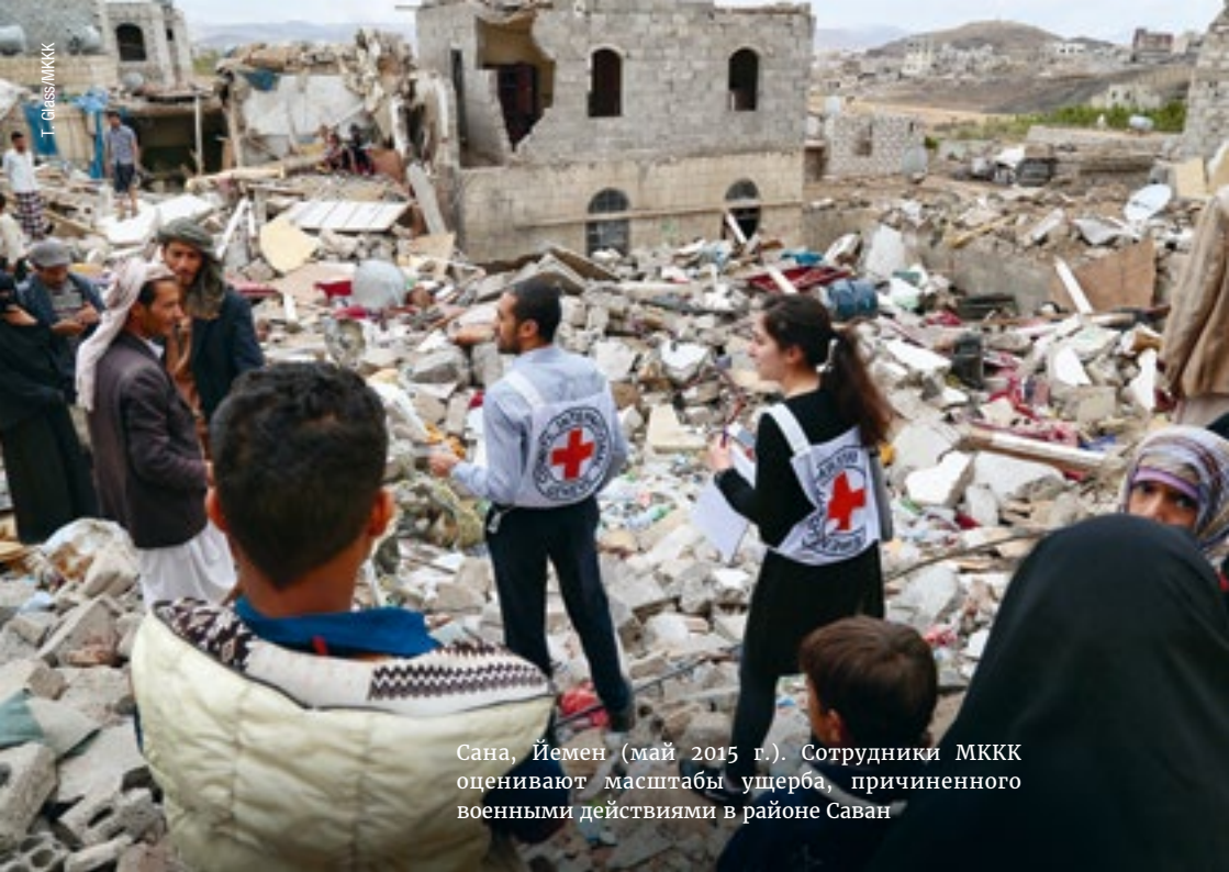
Сана, Йемен (май 2015 г.). Сотрудники МККК оценивают масштабы ущерба, причиненного военными действиями в районе Саван