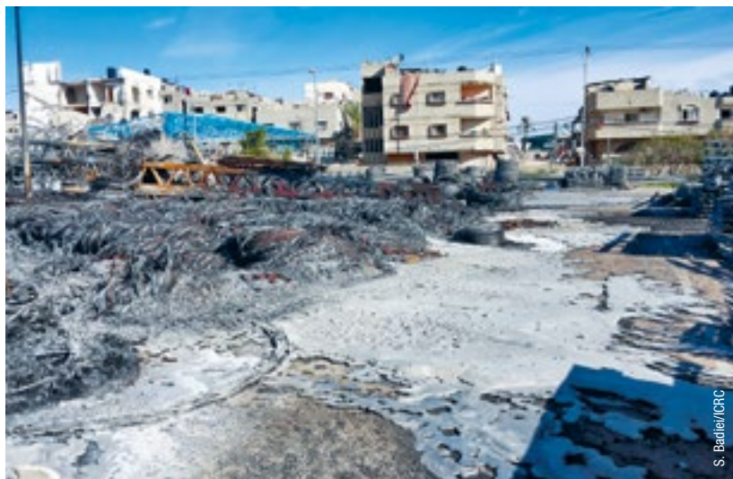
Склад электрооборудования, уничтоженный в ходе конфликта в секторе Газа (2014)