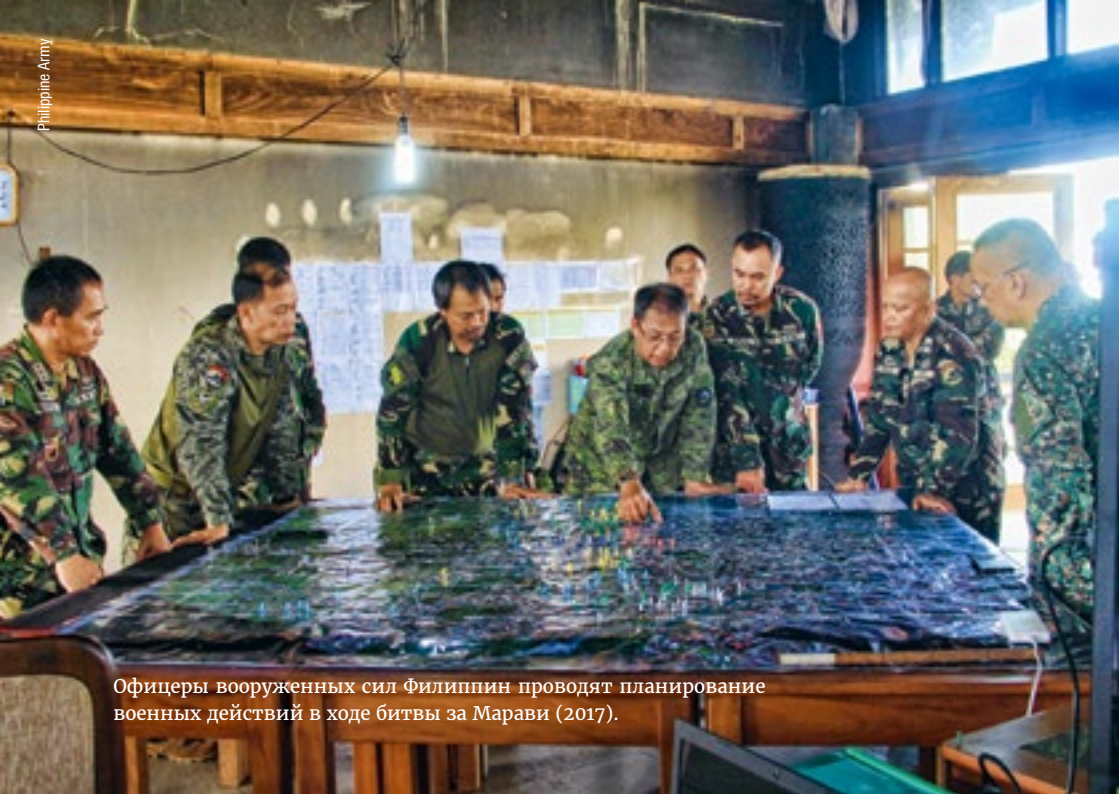
Офицеры вооруженных сил Филиппин проводят планирование военных действий в ходе битвы за Марави (2017).