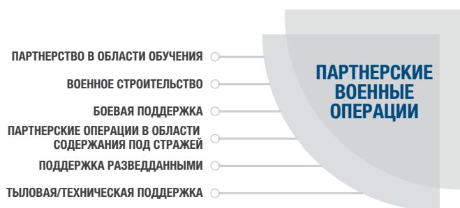
Рис. 2. Шесть категорий партнерских военных операций

Партнерская военная операция — это осознанная договоренность между партнерами для достижения конкретной военной цели в условиях конфликта 8 . В качестве партнера, получающего поддержку, могут выступать вооруженные силы другого государства или негосударственные вооруженные группы. Вооруженные силы часто привлекаются к участию в деятельности, не связанной с конфликтом, наподобие той, что описана в этом разделе. Однако партнерские военные операции согласно определению МККК относятся к конфликту. В этом разделе рассматриваются риски и практические меры, позволяющие предотвратить или уменьшить ущерб гражданскому населению и гражданским объектам в рамках шести категорий партнерских военных операций 9 .