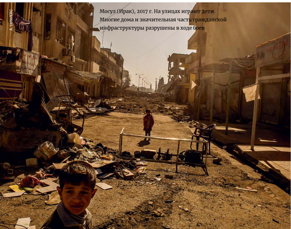
Мосул (Ирак), 2017 г. На улицах играют дети. Многие дома и значительная часть гражданской инфраструктуры разрушены в ходе боев

Оценка и определение параметров необходимы для ответственного проведения партнерской военной операции. Проведение тщательной оценки перед осуществлением операции позволяет командиру заблаговременно выявить риски и выработать меры их снижения.