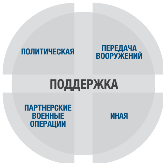
Рис. 1. Виды «отношений поддержки» в рамках вооруженного конфликта

«Отношения поддержки» в условиях вооруженных конфликтов могут принимать различные формы, в том числе форму партнерских военных операций (см. рис. 1 ниже). В рамках партнерских военных операций и других видов «отношений поддержки» существует потенциал сокращения риска для гражданских лиц без негативного воздействия на боеспособность партнеров. В то же время такие отношения могут приводить к повышению риска. На степень риска, с которым сопряжено проведение партнерской военной операции, влияют аспекты, которые практически неподконтрольны партнерским силам, такие как политические цели, политическая воля и ресурсы партнеров. Тем не менее присутствуют и такие ключевые составляющие риска для гражданских лиц, на которые командир мог бы повлиять. Одна из них связана с тем, насколько приоритетной для командира является задача предотвращения и уменьшения ущерба гражданскому населению и гражданским объектам. Об этом можно судить по тому, какое внимание уделяется данной составляющей и насколько она включается в программу подготовки, процессы и сложившуюся практику. Вторая составляющая касается степени влияния командира на силы партнера и формы, которые принимает это влияние.