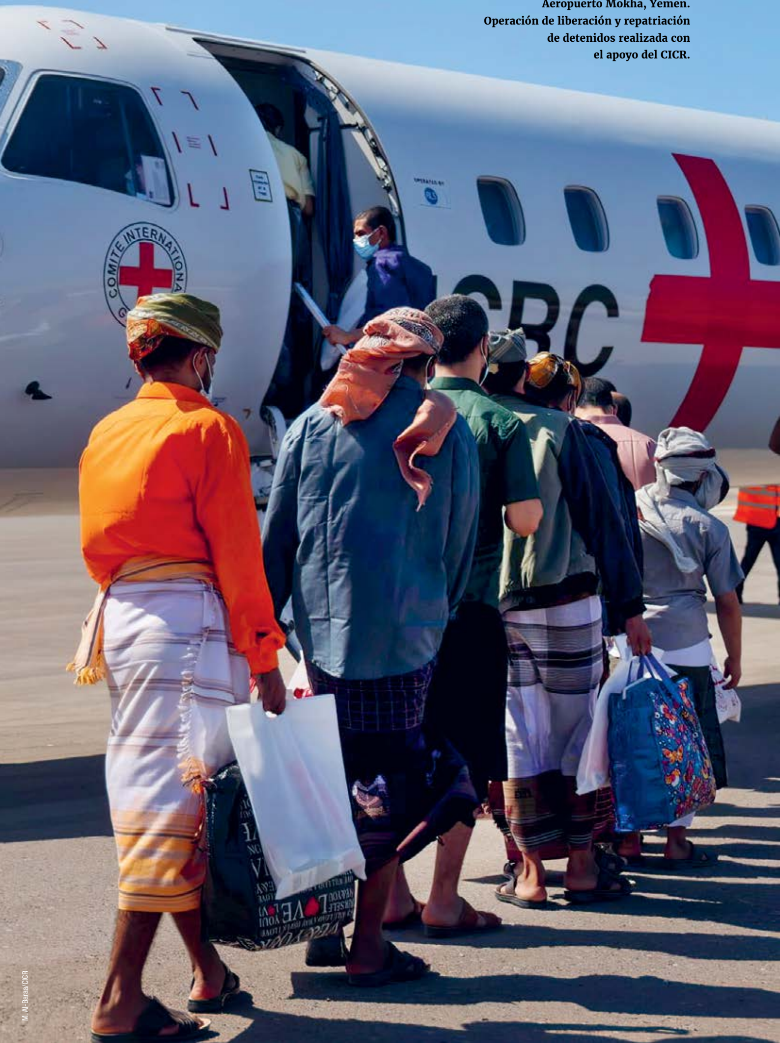
Aeropuerto Mokha, Yemen. Operación de liberación y repatriación de detenidos realizada con el apoyo del CICR.