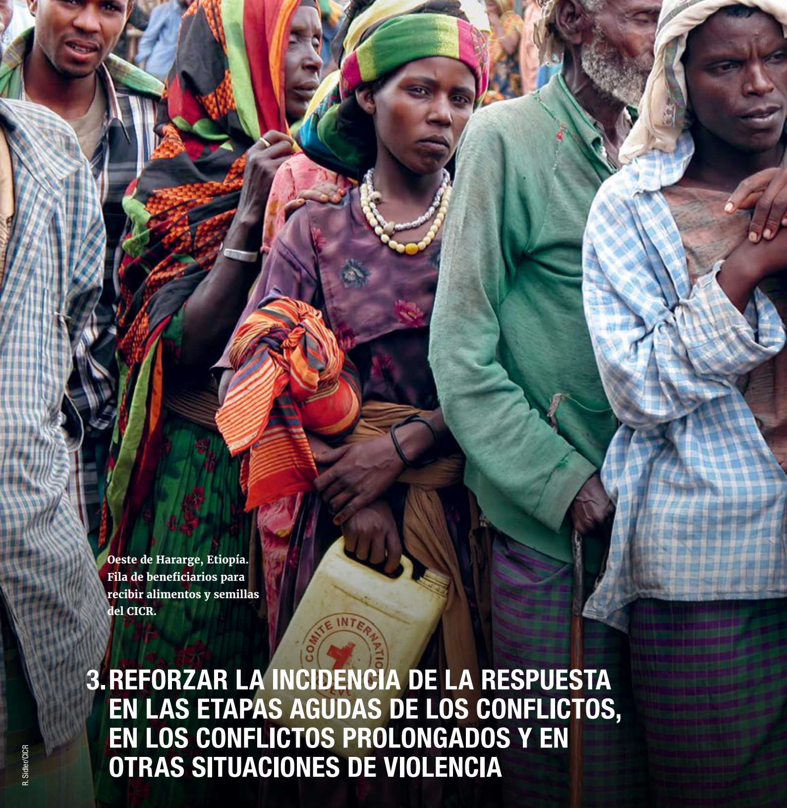
Oeste de Hararge, Etiopía. Fila de beneficiarios para recibir alimentos y semillas del CICR.